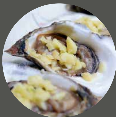
HÀO NƯỚNG PHÔ MAI 焼きカキ(チーズ) Oyster with chesse