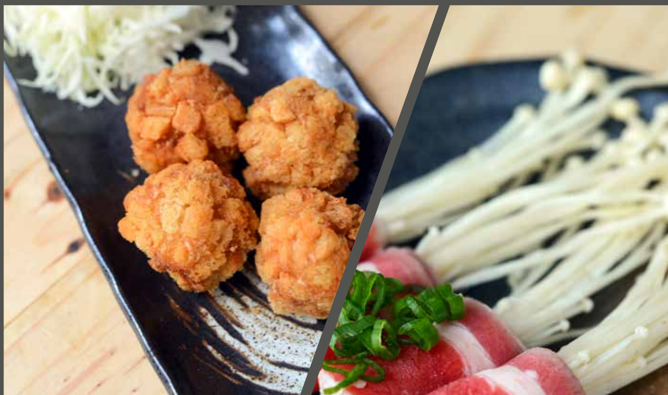
BÁNH TÔM KURUTON 海老くるとん Shrimp crouton ball