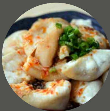
RUỘT NON BÒ 牛の腸 Beef intestine