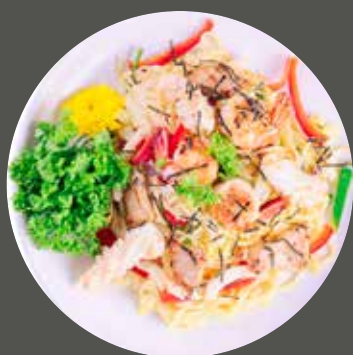
MÌ SOBA XÀO 焼きそば Yakisoba (Fried noodle Japanese style)