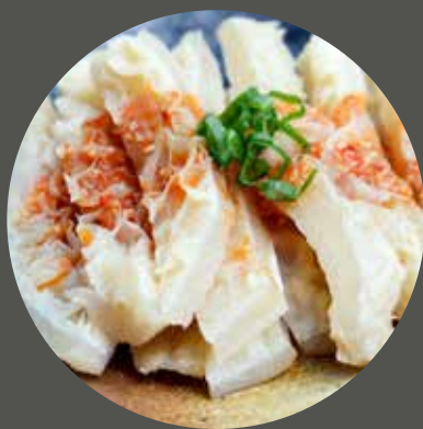
TỔ ONG BÒ ハチノス Beef 2nd stomach