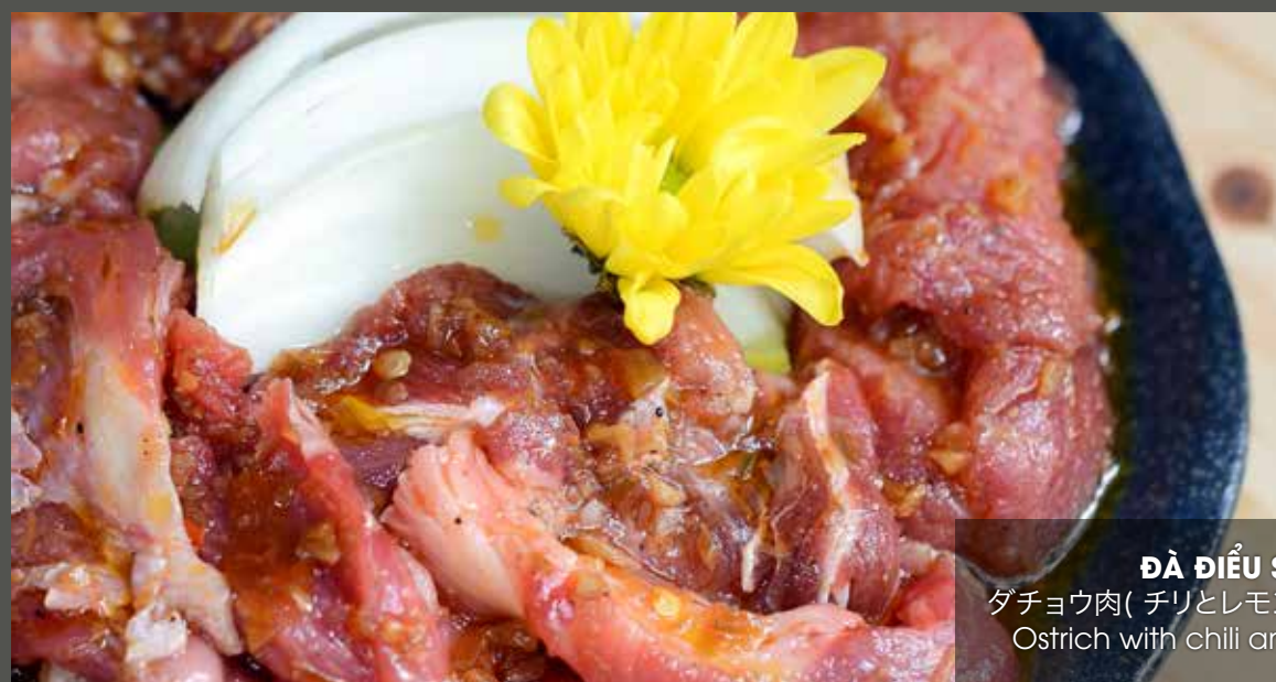
ĐÀ ĐIỂU SA TẾ ダチョウ肉( チリとレモングラスで味付け) Ostrich with chili and lemongrass