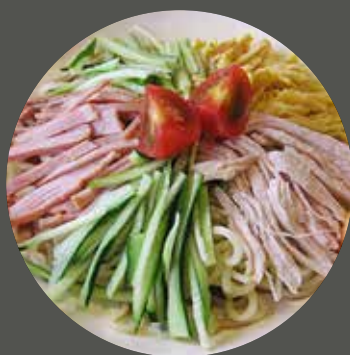
MÌ LẠNH NHẬT BẢN 冷やし中華 Cold noodle Japanese style