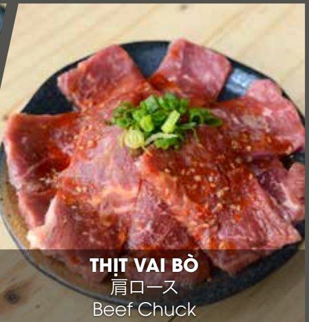
THỊT VAI BÒ 肩ロース Beef Chuck