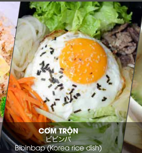
CƠM TRỘN ビビンバ Bibimbap (Korea rice dish)