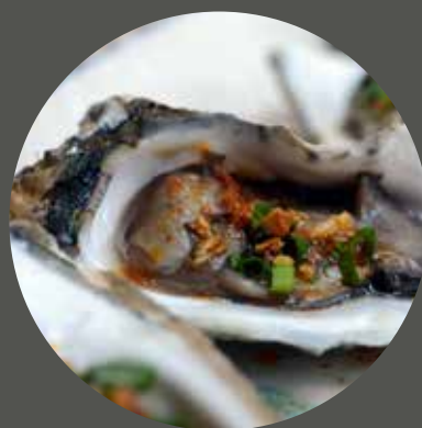
HÀO NƯỚNG TARE 焼きカキ(タレ) Oyster with tare