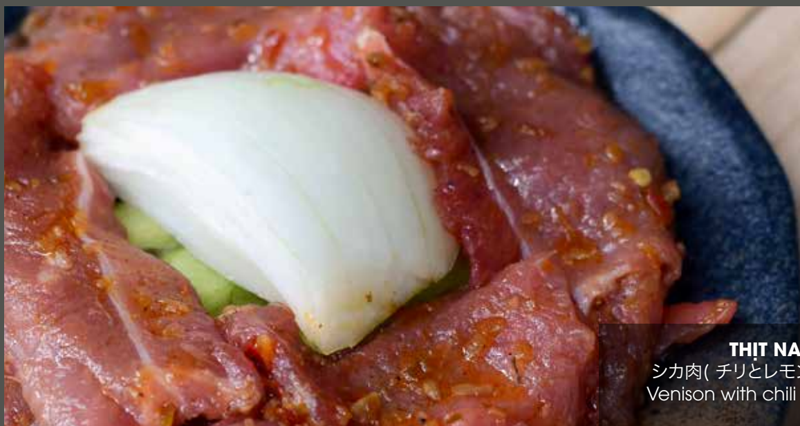
THỊT NAI SA TẾ シカ肉( チリとレモングラスで味付け) Venison with chili and lemongrass