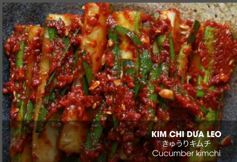
KIM CHI DỨA LEO きゅうりキムチ Cucumber kimchi