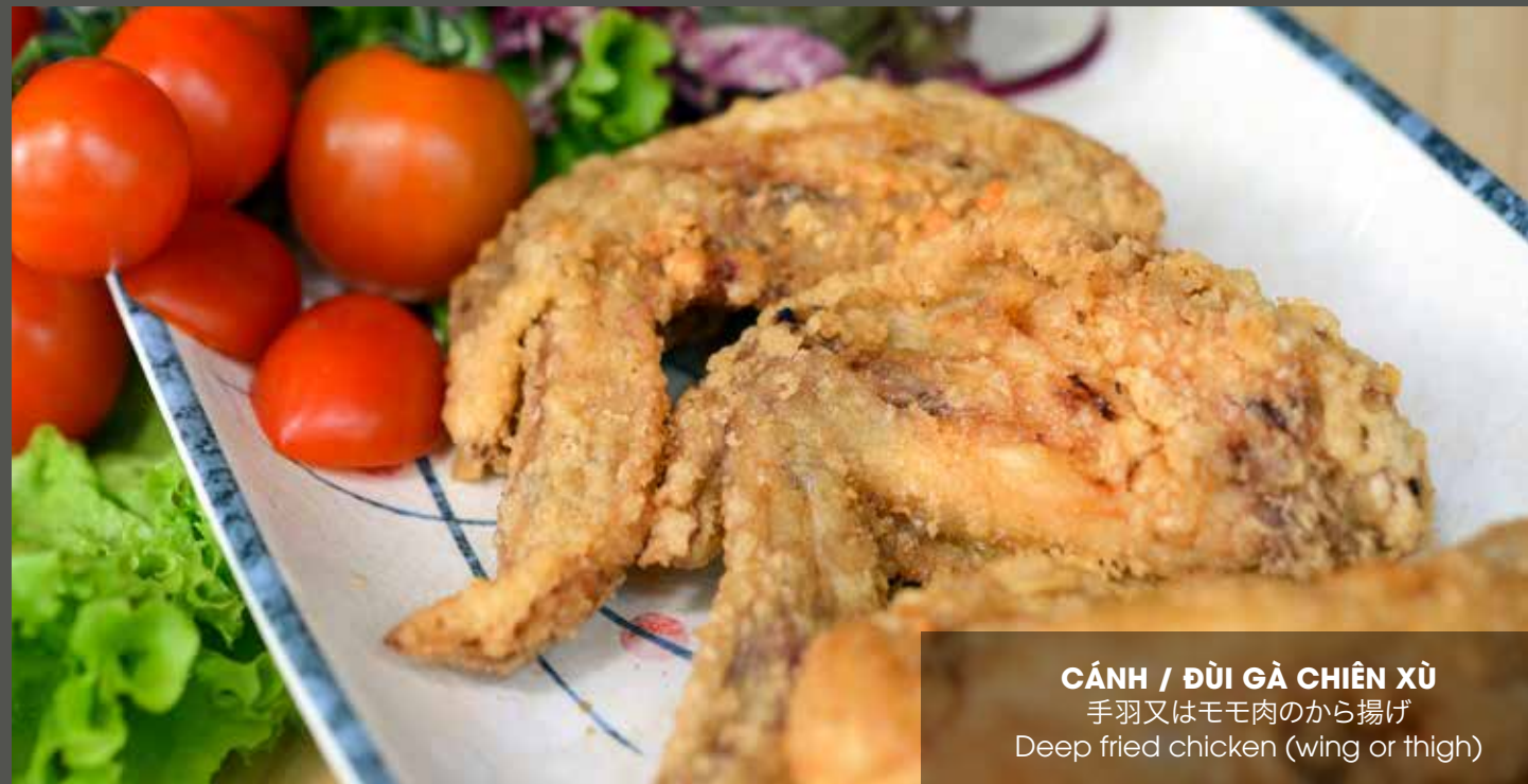
CÁNH / ĐÙI GÀ CHIÊN XÙ 手羽又はモモ肉のから揚げ Deep fried chicken (wing or thigh)