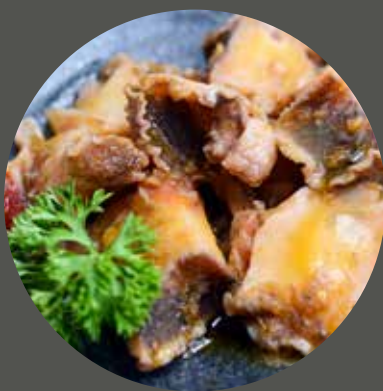
ỐC TỎI NƯỚNG SA TẾ / BƠ TỎI 巻貝(レモングラス風味またはニンニクバター) Top shell with chilli and lemongrass or butter garlic