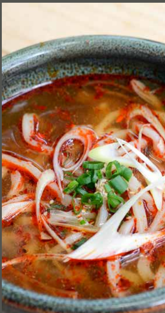
MÌ UDON BÒ CAY 牛卵うどん(辛いスープ) Beef tail soup Udon noodle (spicy)