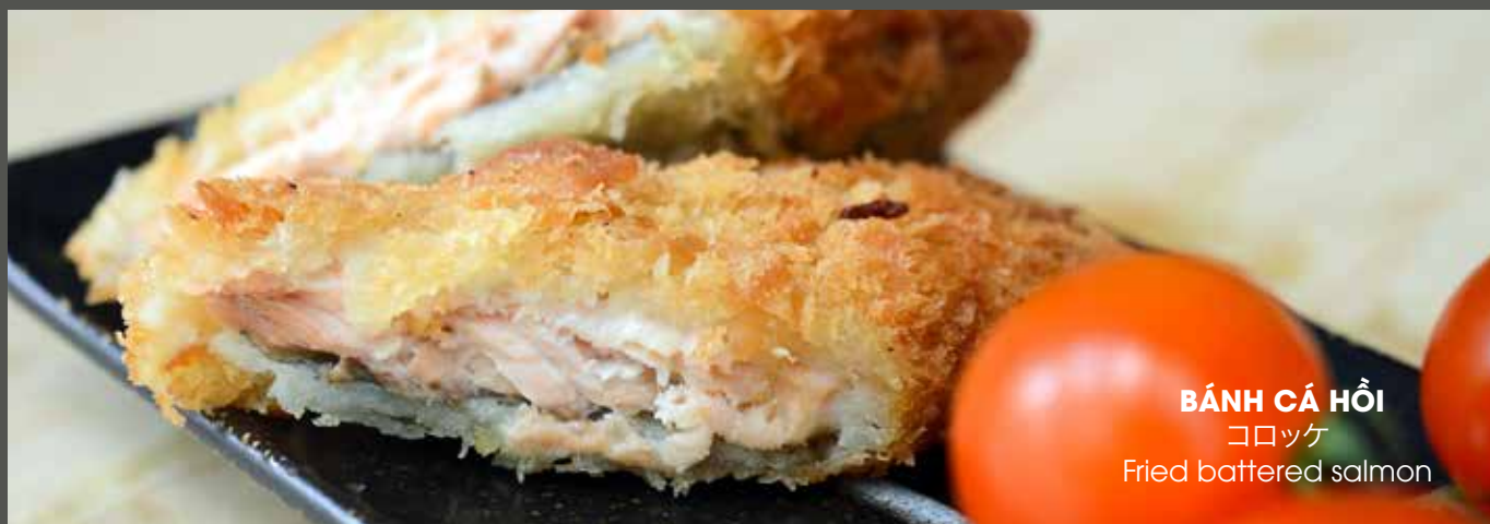
BÁNH CÁ HỒI コロッケ Fried battered salmon