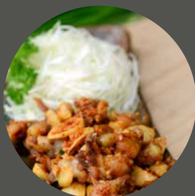
SỤN GÀ CHIÊN GIÒN なんこつから揚げ Deep fried crispy chicken