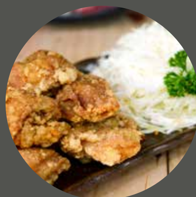
GÀ CHIÊN GIÒN 鶏から揚げ Deep fried crispy chicken