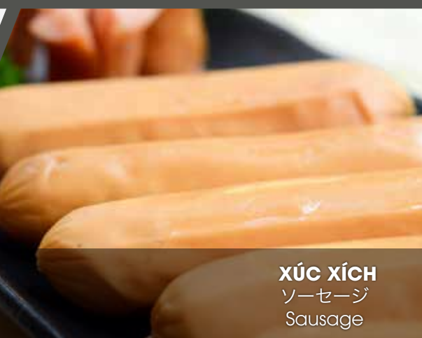
XÚC XÍCH ソーセージ Sausage