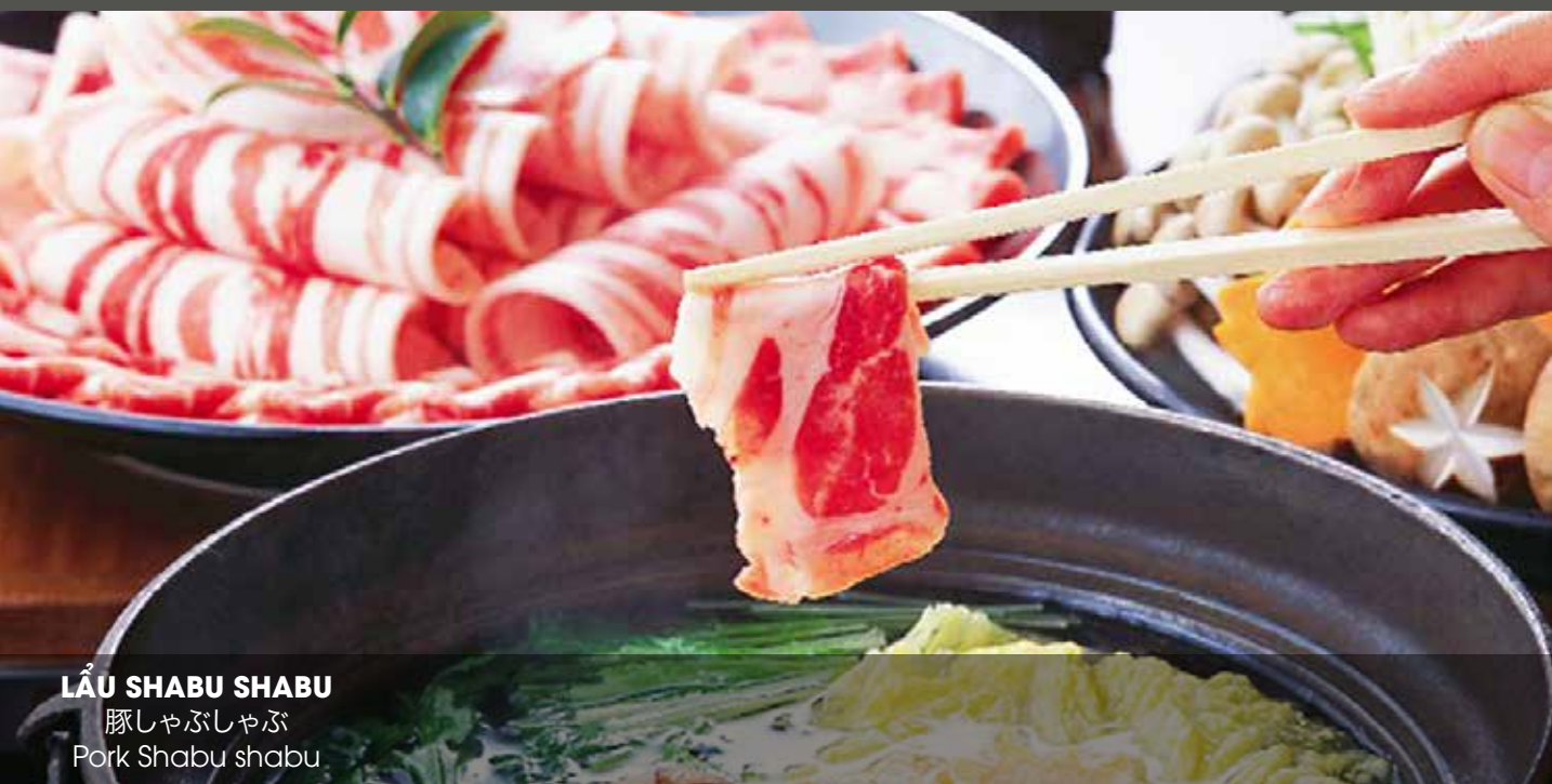
LẦU SHABU SHABU