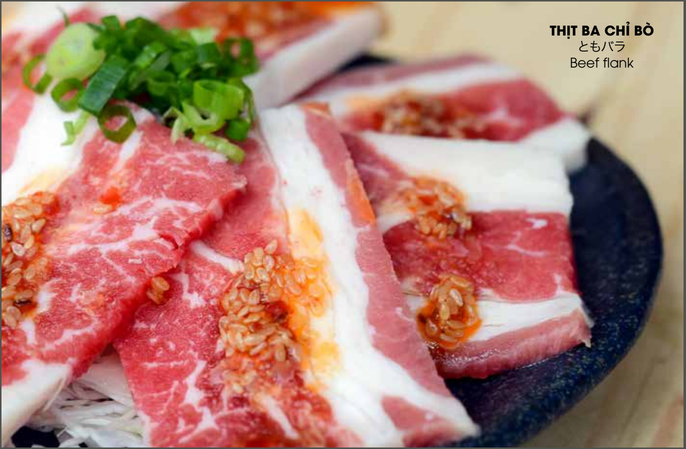
THỊT BA CHỈ BÒ ともバラ Beef flank