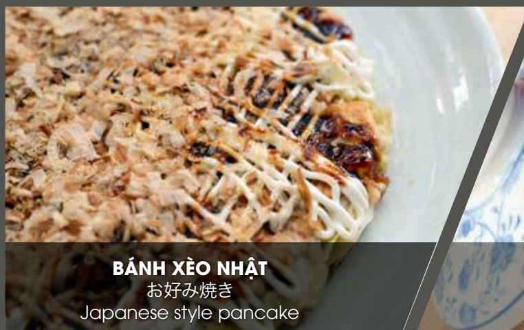
BÁNH XÈO NHẬT お好み焼き Japanese style pancake