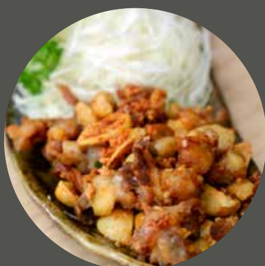
SỤN GÀ RANG MUỐI TỎI なんこつニンニク炒め Fried chicken knee cartilage with salt & garlic