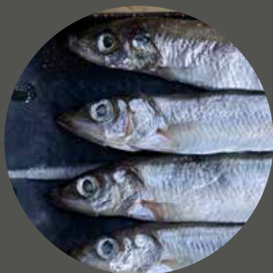
CÁ TRỨNG ししゃも Capelins