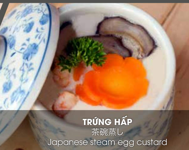
TRỨNG HẤP 茶碗蒸し Japanese steam egg custard