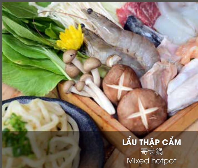
LẦU THẬP CẨM