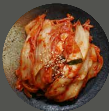
KIM CHI CẢI THẢO 白菜キムチ Cabbage kimchi