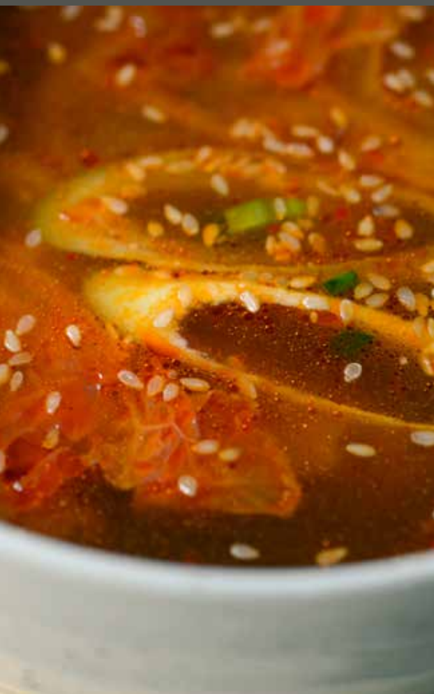
SÚP KIM CHI THỊT HEO 豚キムチスープ Pork kimchi soup