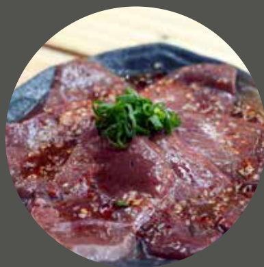
GAN BÒ レバー Beef liver