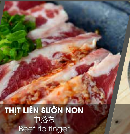
THỊT LIÊN SƯỜN NON 中落ち Beef rib finger