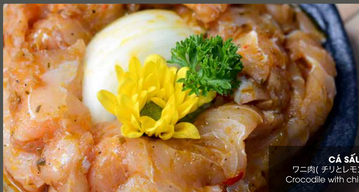
CÁ SẤU SA TẾ ワニ肉( チリとレモングラスで味付け) Crocodile with chili and lemongrass