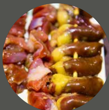
TIM / MỀ GÀ NƯỚNG ハツ / 砂肝 Chicken heart / gizzard