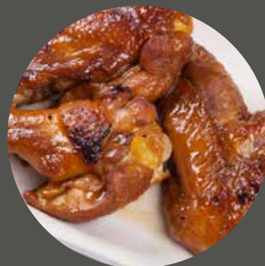
CÁNH GÀ NƯỚNG 手羽 Chicken wings