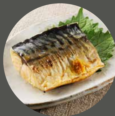
CÁ SABA NƯỚNG MUỐI サバ Spanish mackerel