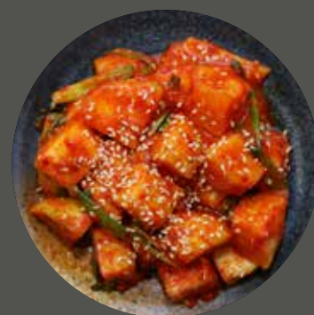
KIM CHI CỦ CẢI 大根キムチ Radish kimchi