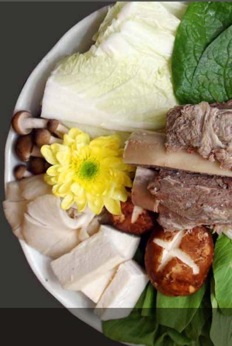
LẦU ĐUÔI BÒ