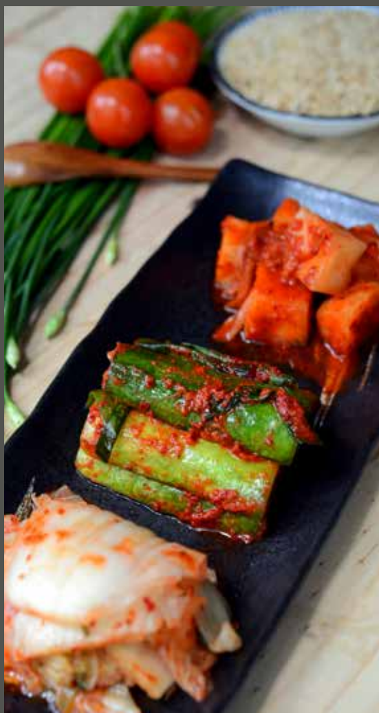
KIM CHI THẬP CẨM キムチ盛り合わせ Assorted kimchi