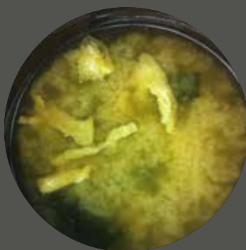
SÚP TRỨNG 卵スープ Egg soup