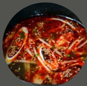
SÚP BÒ CAY 牛肉の辛いスープ Spicy beef soup