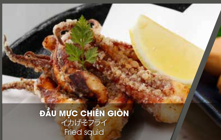
ĐẦU MỰC CHIÊN GIÒN イカげそフライ Fried squid