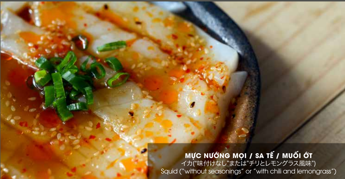
MỰC NƯỚNG MỘI / SA TẾ / MUỐI ỚT イカ("味付けなし"または"チリとレモングラス風味") Squid ("without seasonings" or "with chili and lemongrass")