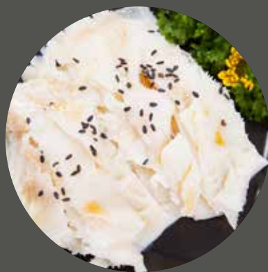
KHĂN LÔNG BÒ センマイ Beef 3rd stomach