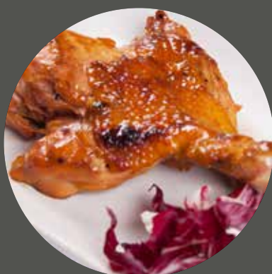
ĐÙI GÀ NƯỚNG 鶏モモ肉 Chicken thigh