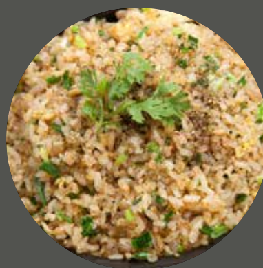
CƠM CHIÊN CÁ MẶN 塩辛い魚のチャーハン Fried rice with salty fish