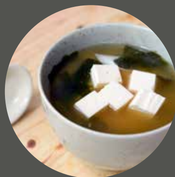
SÚP MISO 味噌汁 Miso soup