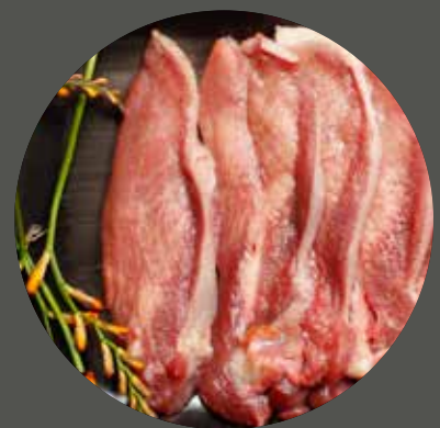
LƯỠI BÒ タン Beef tongue