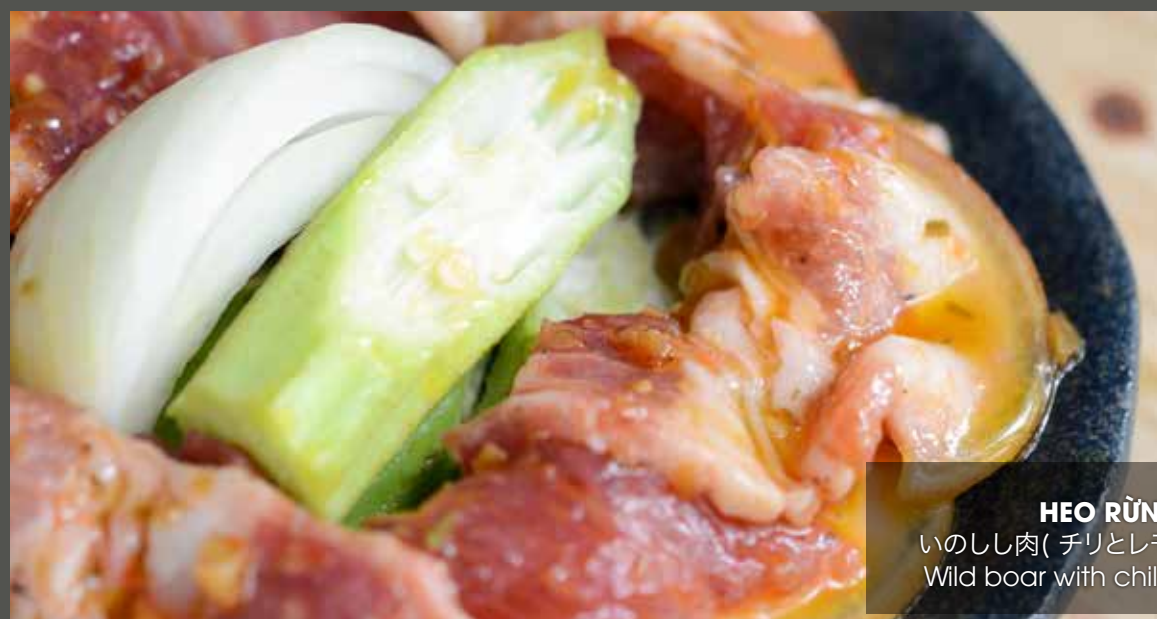
HEO RỪNG SA TẾ いのしし肉( チリとレモングラスで味付け) Wild boar with chili and lemongrass