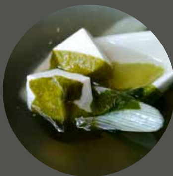
SÚP RONG BIỂN わかめスープ Wakame soup