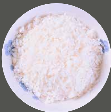
CƠM TRẮNG 白いご飯 Rice