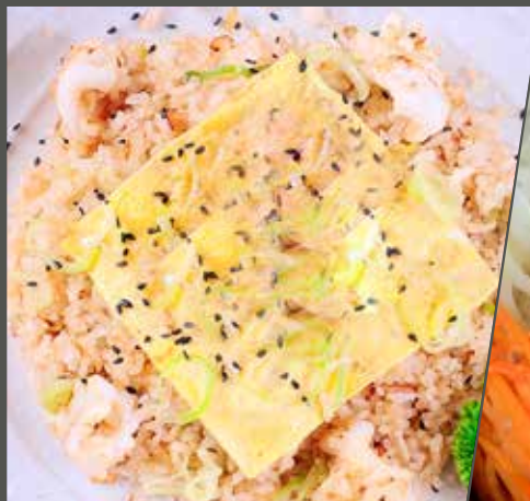
CƠM CHIÊN TỎI TRỨNG 卵チャーハン Fried rice with egg and garlic