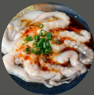
BẠCH TUỘC NƯỚNG MỘI/ SA TẾ/ MUỐI ỚT タコ("味付けなし"または"チリとレモングラス風味") Octopus ("without seasonings" or "with chili and lemongrass")