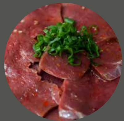
TIM BÒ ハツ Beef Heart