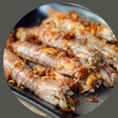
TÔM TÍCH CHÁY TỎI シヤコにんにく揚げ Fried mantis shrimp with garlic