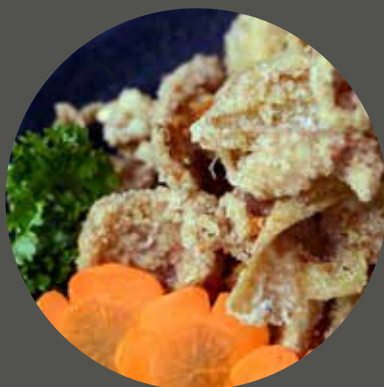
DA GÀ CHIÊN GIÒN 皮のから揚げ Fried chicken skin