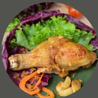
CÁNH / ĐÙI GÀ RANG MUỐI TỎI 手羽又はモモ肉の塩ニンニク炒め Fried chicken with salt & garlic (wing or thigh)