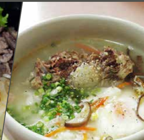
CƠM SÚP ĐUÔI BÒ テールクツパおすすめ! Rice soup with beef tail