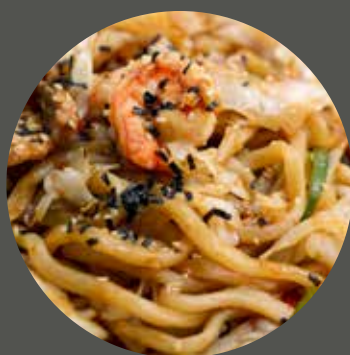
MÌ UDON XÀO 焼うどん Yakiudon (Fried Udon noodle Japanese style)